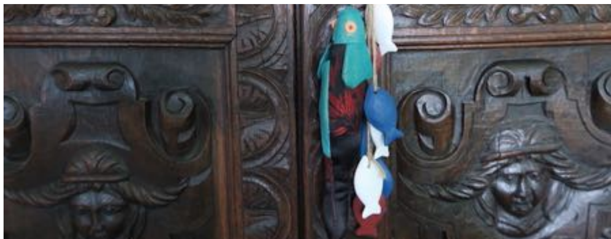
Armoire XVIII d'un marin Breton

Les tissus d'Equateur fabriqués de manière artisanale, sont principalement réalisés dans la région d'Otavalo, au Nord de l'Equateur. Des tissus de qualité aux couleurs très vives