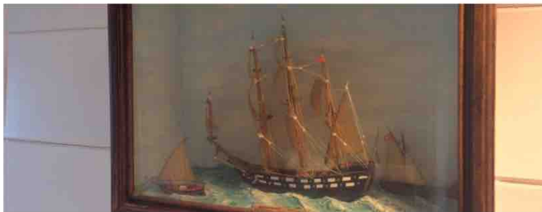
Maquette réalisée par un terre-neuvas

Incrustés dans le parquet en chêne des carreaux de ciment sont aux motifs de la mer. Une grande glace d'Indonésie, ornée de coquillages trône au-dessus du lavabo tout blanc et bleu