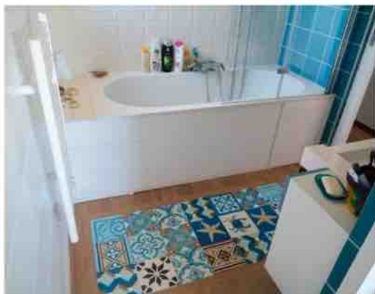
Carreaux de ciment

Incrustés dans le parquet en chêne des carreaux de ciment sont aux motifs de la mer. Une grande glace d'Indonésie, ornée de coquillages trône au-dessus du lavabo tout blanc et bleu